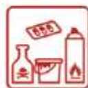
Médicaments Produits toxiques